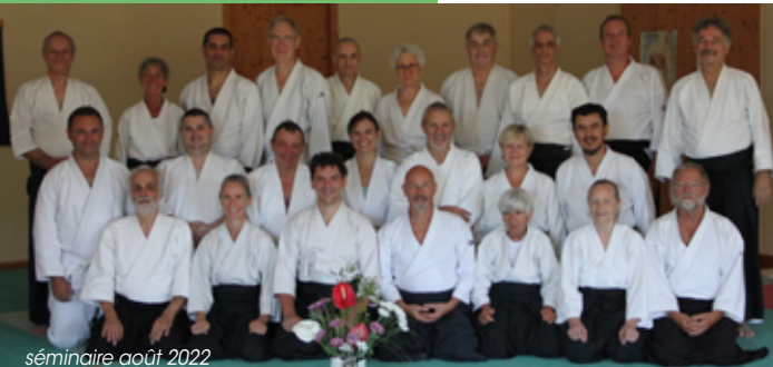
séminaire août 2022