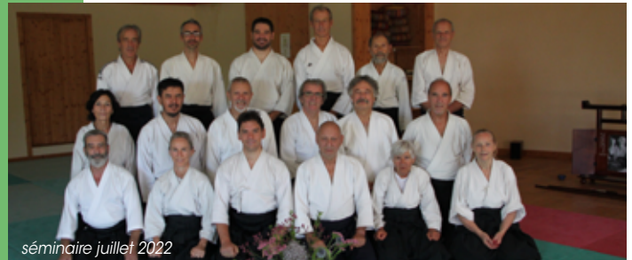
séminaire juillet 2022