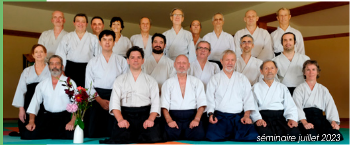
séminaire juillet 2023