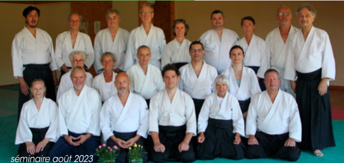
séminaire août 2023