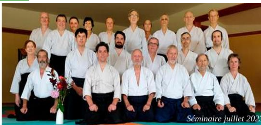
Séminaire juillet 2023