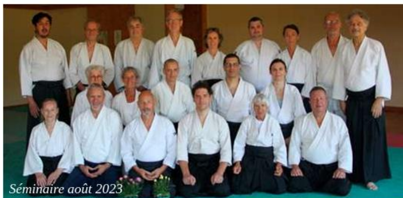
Séminaire août 2023